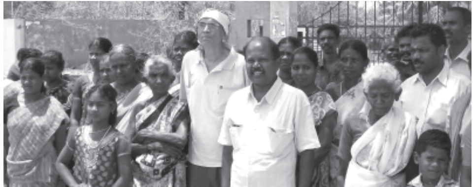
പ്ലാച്ചിമട സമരത്തിന് ഐക്യദാർഢ്യവുമായി പശ്ചിമഘട്ട പരിസ്ഥിതി സംരക്ഷണ വിദഗ്ദ്ധസമിതി ചെയർമാൻ പ്രൊഫ. മാധവ് ഗാഡ്ഗിൽ പ്ലാച്ചിമടയിലെത്തിയപ്പോൾ. ആദ്യമായാണ് അദ്ദേഹം പ്ലാച്ചിമടയിലെത്തുന്നത്.

⇒ മുഖ്യധാരാ രാഷ്ട്രീയ പാർട്ടികളെല്ലാം സമരത്തെ കൈവിട്ട സ്ഥിതിയാണുള്ളത് ⇒