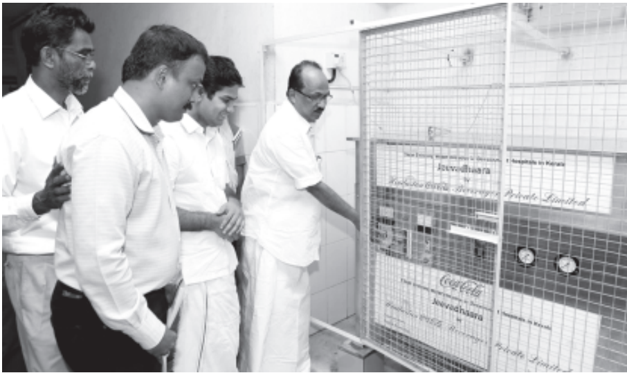
കോളയുടെ കുടിവെള്ള പദ്ധതി കേന്ദ്രമന്ത്രി കെ.വി. തോമസ് എറണാകുളം ജനറൽ ആശുപത്രിയിൽ ഉദ്ഘാടനം ചെയ്യുന്നു

പ്ലാച്ചിമടയിൽ വരുത്തിയ നാശനഷ്ടങ്ങൾക്ക് പരിഹാരമായി ഉന്നതാധികാര സമിതി കണക്കിലാക്കിയ നഷ്ടപരിഹാരം നൽകില്ലെന്ന് പരസ്യമായി പറയുകയും നഷ്ടപരിഹാരം കോളയിൽ നിന്നും ഈടാക്കുന്നതിനായി സർക്കാർ രൂപീകരിച്ച പ്ലാച്ചിമട ട്രിബ്യൂണലിനെ തകർക്കാൻ ശ്രമിക്കുകയും ചെയ്യുന്ന കൊക്കക്കോള കേരളത്തിൽ ശുദ്ധജലം വിതരണം ചെയ്യാനെത്തുന്നതിലെ അന്യായം രാഷ്ട്രീയസംവിധാനങ്ങൾ കാണാതിരുന്നത് എന്തിനാണെന്ന ചോദ്യം കോർപ്പറേറ്റ് ആധിപത്യത്തിന്റെ വാഴ്ചകളിലേക്കാണ് നമ്മളെ എത്തിക്കുന്നത്.