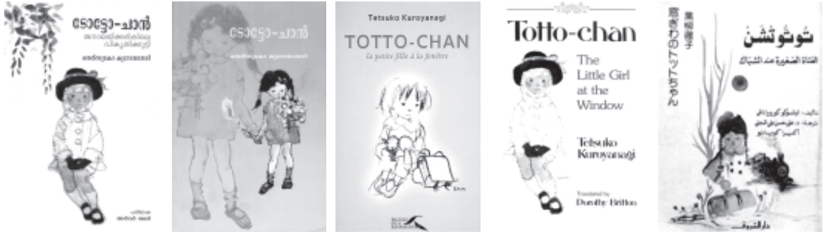
പല കാലങ്ങളിലെ, പല ഭാഗങ്ങളിലെ ടോട്ടോ-ചാൻ കവറുകൾ

⇒ നോക്കൂ നടക്കൽ എന്നാൽ കാലുകൊണ്ടുമാത്രമുള്ള ഒരു സംഗതിയാണോ? ⇨