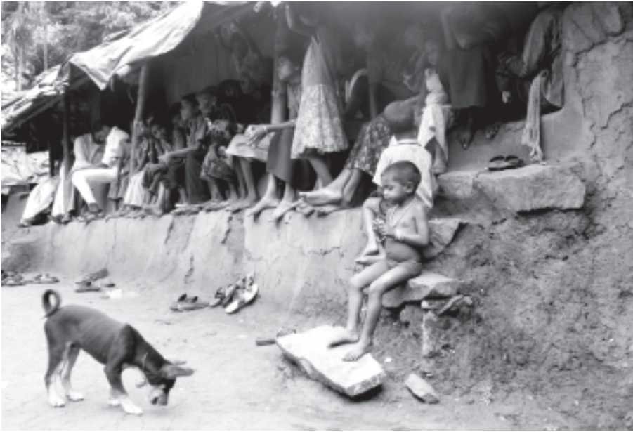
കൊട്ടമരട്ട് കോളനിയിലെ കുട്ടികൾ നാല് കുടുംബങ്ങൾ കഴിയുന്ന ഇടിഞ്ഞു വീഴാറായ മൺവീടിന് മുന്നിൽ

വീട്ടിൽ മൂന്നും നാലും കുടുംബങ്ങൾ താമസിക്കുന്നു. ഇടിഞ്ഞുവീഴാതെ താങ്ങിനിർത്താൻ ഏറെ പണിയെടുത്തിട്ടുള്ള കാലപ്പഴക്കം ചെന്ന മൺവീടുകൾ മാത്രമാണ് കോളനിയിലുള്ളത്. മുത്തങ്ങ സമരത്തെ തുടർന്നുണ്ടായ പീഡനങ്ങളും മാനസിക സംഘർഷങ്ങളും സമൂഹം ഒറ്റപ്പെടുത്തിയതിന്റെ അന്യതാബോധവും അവരെ തളർത്തിയിട്ടില്ല. മുത്തങ്ങസമരത്തിന്റെ അനിവാര്യതയെക്കുറിച്ചുള്ള വ്യക്തമായ ബോധം ഇന്നും അവർക്ക് കരുത്തായി നിൽക്കുന്നു. സ്വന്തമായി ഒരു തുണ്ട് ഭൂമിപോലുമില്ലാത്തതിന്റെ ദുരന്തം തലമുറകളായി പിന്തുടരുന്നതിന്റെ ദൈന്യത അവരുടെ വാക്കുകളിൽ നിഴലിച്ചിരുന്നു. കോളനി ഇപ്പോൾ നിൽക്കുന്ന ഭൂമിയിലും അവർക്ക് അവകാശമില്ല. താവഴിയായി കൈമാറി വന്ന പട്ടയമില്ലാത്ത സ്ഥലം. മുത്തങ്ങയിലെ പോലീസ് വേട്ടയിൽ നഷ്ടപ്പെട്ട അധാനിച്ചുണ്ടാക്കിയ സമ്പാദ്യങ്ങളെല്ലാം വീണ്ടും സ്വരക്കൂട്ടാൻ ഇന്നും അവർ ഏറെ പ്രയാസപ്പെടുന്നു. വരും നാളുകളിലെങ്കിലും അടിമജീവിതത്തിൽ നിന്നും കരകയറാനാകുമെന്ന പ്രതീക്ഷയിൽ 37 കുട്ടികൾ കോളനിയിൽ നിന്നും സ്കൂളിൽ പോകുന്നുണ്ട്. മുത്തങ്ങ സമരത്തിൽ ജയിലിൽ പോയ കുട്ടികളുമുണ്ട് ആ കുട്ടത്തിൽ. പക്ഷെ കോളനിയുടെ പിന്നോക്കാവസ്ഥ നല്ല രീതിയിലുള്ള വിദ്യാഭ്യാസത്തിനും ഇവർക്ക് വിലങ്ങുതടിയായി നിൽക്കുന്നു. കോളനിയിലുള്ള ഏകാധ്യാപക വിദ്യാലയത്തിലും ചെറിയ കുട്ടികൾ പഠിക്കാനെത്തുന്നുണ്ട്. അവിടെ ഉച്ചക്കഞ്ഞി കിട്ടുമെന്നത് അവർക്ക് അതിലേറെ ആശ്വാസമായിത്തീരുന്നു.