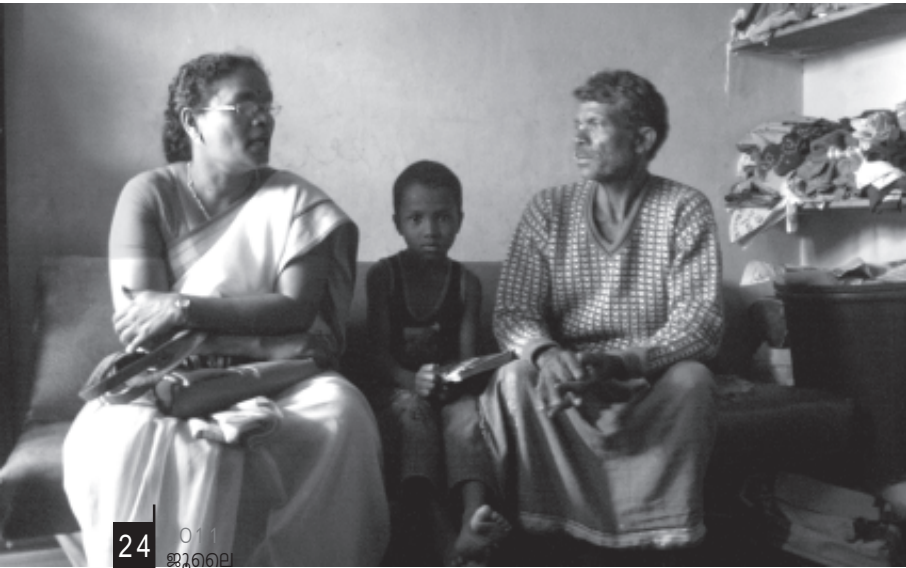
24 011 ജൂലൈ

രിച്ചുകൊണ്ടിരുന്നു. പുൽപ്പള്ളിയിലേക്കായിരുന്നു ആദ്യം പോയത്. കൊട്ടമരട്ട് കോളനി, 14 സെന്റ് സ്ഥലം, 22 വീട്, 67 കുടുംബങ്ങൾ പുൽപ്പള്ളി ടൗണിൽ നിന്നും നാല് കിലോമീറ്റർ അകലെയുള്ള കൊട്ടമരട്ട് കോളനിയിലേക്കാണ് ആദ്യം പോയത്. ജില്ലയിലെ തന്നെ കടുത്ത പിന്നോക്കാവസ്ഥ നേരിടുന്ന കോളനികൾ ഒന്നാണ് കൊട്ടമരട്ട് കോളനി. കോളനിയിലെ എല്ലാ കുടുംബങ്ങളും മുത്തങ്ങ സമരത്തിൽ സജീവമായുണ്ടായിരുന്നു. 14 സെന്റ് സ്ഥലത്ത് 67 കുടുംബങ്ങളാണ് കൊട്ടമരട്ട് കോളനിയിൽ താമസിക്കുന്നത്. ഒരു