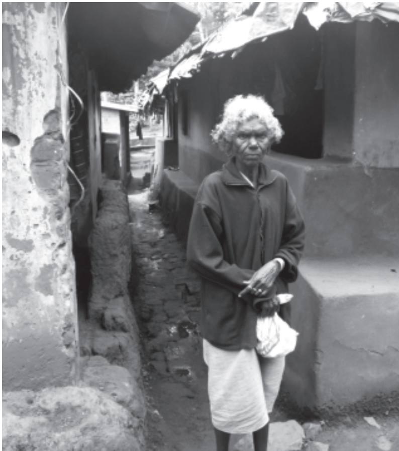
പുൽപ്പള്ളിയിലെ കൊട്ടമരട്ട് കോളനിയിലെ ആദിവാസി വൃദ്ധ