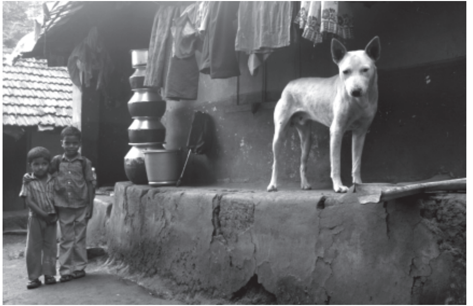
കൊട്ടമരട്ട് കോളനിയിൽ നിന്നുള്ള ദൃശ്യം

ഒളിസേവ ചെയ്തതോടെ അടിച്ച മർത്തൽ അതിവേഗം കുറഞ്ഞു. സമ രചരിത്രത്തിലെ നിർണ്ണായക മുന്നേറ്റമായി മുത്തങ്ങ മാറിയിട്ടും ഭരണകൂടത്തിന്റെയും വരേണ്യവർഗ്ഗത്തിന്റെയും വംശീയാധിപത്യത്തിന് ആദിവാസി സമൂഹം തുടർന്നും ഇരകളാകുന്ന കാഴ്ചയാണ് കേരളം കണ്ടത്. മുത്തങ്ങ സമരത്തിൽ പങ്കെടുത്തതിനെ തുടർന്ന് തീവ്രവാദികളും വനം കയ്യേറ്റക്കാരുമായി മൂലകൂത്തപ്പെട്ട ആദിവാസികൾ ഇന്നെവിടെയാണ്. മുത്തങ്ങയിലെ സംഭവവികാസങ്ങളെത്തുടർന്ന് അറസ്റ്റ് വരിക്കുകയും കാട്ടിലേക്ക് ഓടിരക്ഷപ്പെടുകയും ചെയ്ത വരേണ്യം കോളനികളിലെ ദുരിതങ്ങളി