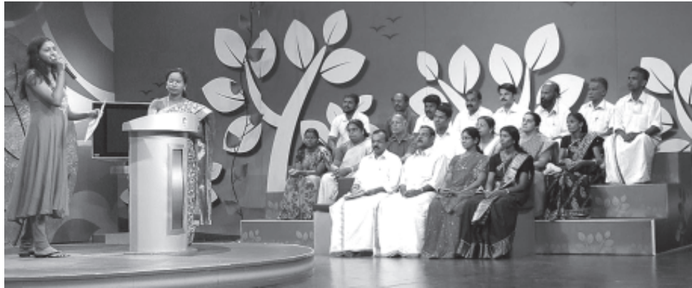
ദൂരദർശൻ സംഘടിപ്പിച്ച ഗ്രീൻ കേരള എക്സ്‌പ്രസ് പരിപാടിയിൽ നിന്നും

പാളിച്ചകളുണ്ടായെങ്കിലും 1993ൽ നിലവിൽ വന്ന 73, 74 ഭരണഘടനാ ഭേദഗതിയെ അർത്ഥപൂർണ്ണമാക്കുന്നതിൽ നിർണ്ണായക പങ്കുവഹിച്ച സംസ്ഥാനമായി കേരളം മാറി. കേന്ദ്രീകൃത ഘടനയുടെ ശീലങ്ങളിൽ കുടിങ്ങിക്കിടക്കുകയും അധികാരവികേന്ദ്രീകരണത്തിന്റെ സത്ത ഉൾക്കൊള്ളാൻ കഴിയാതെ പോവുകയും ചെയ്ത സർക്കാർ വകുപ്പുകളാണ് അതിന്റെ പൂർണ്ണാർത്ഥത്തിലുള്ള നടപ്പിലാക്കലിന് തടസ്സമായിത്തീർന്നത്. എന്നാലും ദേശീയ നിലവാരമെടുത്താൽ, വികസന നയപരിപാടികളുടെ ആസൂത്രണത്തിലും നടപ്പിലാക്കലിലും കേരളത്തിലെ തദ്ദേശസ്വയംഭരണ സ്ഥാപനങ്ങൾ ഏറെ മുന്നിലാണെന്ന് സംശയമേതുമില്ലാതെ പറയാം. വിദ്യാഭ്യാസം, ആരോഗ്യം, ജലസേചനം തുടങ്ങിയ ഒട്ടേറെ വകുപ്പുകളെ ഭാഗീകമായെങ്കിലും പഞ്ചായത്ത് തലത്തിലേക്ക് കൊണ്ടുവരാനും കൂടുതൽ ജനോപകാരപ്രദമാക്കാനും കഴിഞ്ഞിട്ടുണ്ട്. ഇനിയും പൂർണ്ണതയിലെത്തിക്കാൻ കഴിയാതെ പോയ പരിപാടിയാണ് ജനകീയാസൂത്രണം. അത് പൂർത്തിയാക്കുന്നതിന് പകരം, ഈ സർക്കാർ അധികാരമേറ്റ കാലം മുതൽ വികേന്ദ്രീകൃതാസൂത്രണ പരിപാടികളെ അട്ടിമറിക്കാനുള്ള ശ്രമമാണ് നടത്തുന്നത്. പ്രാദേശിക വികസനപ്രക്രിയയ്ക്കുള്ള ഊന്നൽ കുറഞ്ഞു.