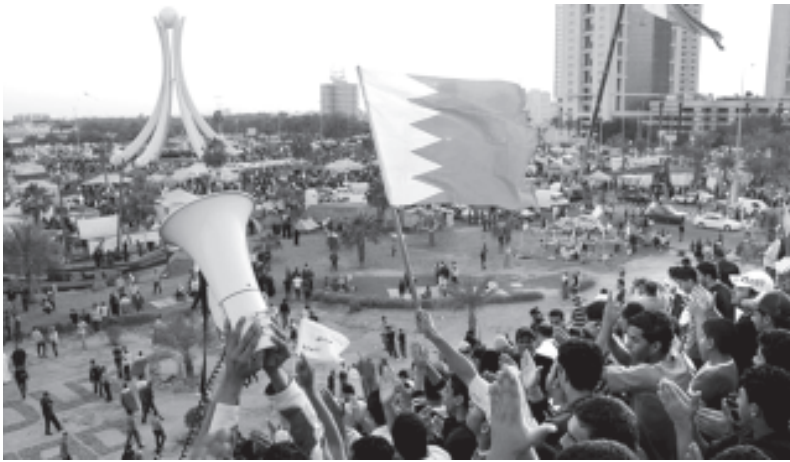
ബഹ്റിനിലെ പേൾ സ്കയറിൽ തടിച്ചുകൂടിയ പ്രക്ഷോഭകാരികൾ. പേൾ സ്കയറിനെ 300 അടിയിലേറെ ഉയരമുള്ള ശില്പവും ചിത്രത്തിൽ കാണാം. ജനാധിപത്യ പ്രസ്ഥാനത്തിന്റെ അഭിമാനചിഹ്നമായാണ് പ്രക്ഷോഭകാരികൾ ഈ ശില്പത്തെ പരിഗണിച്ചിരുന്നത്

യുൽപ്പാദനത്തിന്റെ ഒരു മുഖ്യകേന്ദ്രമായി കണക്കാക്കാവുന്ന രാജ്യമല്ല. ഈജിപ്തിലും ടുണീഷ്യയിലും ഈ വിഭാഗത്തിൽപ്പെടുന്ന വേറെ ചില രാജ്യങ്ങളിലും അമേരിക്കൻ കലിയുടെ തന്ത്രങ്ങൾ അല്പം വ്യത്യസ്തത പുലർത്തുന്നു. സർവ്വസാധാരണമായും ആവർത്തിച്ചും പ്രയോഗിക്കപ്പെടുന്ന ഈ തന്ത്രങ്ങൾ കാണാൻ വലിയ ബുദ്ധിമുട്ടുണ്ടാകുമെന്നും ആവശ്യമില്ല. നയന്ത്ര വകുപ്പിൽ ജോലി നോക്കാൻ നിങ്ങൾക്കുവേണ്ടി താൽപര്യമുള്ള പക്ഷം അത് ശ്രദ്ധിച്ചു പഠിക്കേണ്ടതാണ്. നമുക്ക് വേണ്ടപ്പെട്ട സ്വേച്ഛാധിപതിയായ ഭരണകർത്താവ് ആ രാജ്യങ്ങളിൽ ഓരോന്നിലും ഉള്ള പക്ഷം അയാളുടെ നില എന്താണെന്ന് തുടർച്ചയായി നിരീക്ഷിക്കുക. അയാൾക്ക് എതിരെ ജനകീയ സമ്മർദ്ദങ്ങൾ ശക്തിപ്പെടുത്തുന്നവെങ്കിൽ പറ്റുന്നിടത്തോളം അയാളെ സഹായിക്കുക. പക്ഷേ സൈന്യമടക്കം അയാൾക്കെതിരെ തിരിയുകയും ജനങ്ങൾ ബഹുഭൂരിപക്ഷവും അയാളെ തള്ളിപ്പറയുകയും ചെയ്യുന്ന ഘട്ടത്തിൽ നമുക്ക് തുടർന്ന് സഹായിക്കാനാവില്ല. അപ്പോൾ ജനാധിപത്യത്തെക്കുറിച്ച് മുഴക്കമുള്ളതെന്തോന്നുന്ന പ്രഖ്യാപനങ്ങൾ നടത്തുകയും അതോടൊപ്പം വെറുക്കപ്പെട്ട ഭരണാധികാരിയെ എങ്ങോട്ടെങ്കിലും മാറ്റിപ്പാർപ്പിച്ച ശേഷം പഴയ ഭരണവ്യവസ്ഥയെ തുടർന്ന് നിലനിൽക്കാൻ സഹായിക്കുകയും ചെയ്യും. വേണമെങ്കിൽ പേരുകളിൽ മാറ്റം വരുത്താം. എല്ലായിടത്തും എപ്പോഴും അത് വിജ