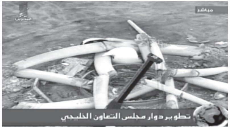
ബഹ്റിനിലെ ജനകീയപ്രക്ഷോഭത്തെ തുടർന്ന് സൗദി അറേബ്യൻ സൈന്യത്തിന്റെ സഹായത്തോടെ ഭരണകൂടം നശിപ്പിച്ച പേൾ സ്കയറിനെ ശില്പം

തെന്ന് കൃത്യമായും നമുക്കറിയില്ല. എന്നാൽ മറ്റൊരു വിഭാഗത്തിൽപ്പെടുന്ന ഭരണകൂടങ്ങളും ഉണ്ട്. എണ്ണപ്പണക്കാരനായ സ്വേച്ഛാധികാരിയായും ഭരണകർത്താവാണ്. പക്ഷേ അയാൾ വിശ്വസ്തനായിരിക്കുകയില്ല. ഉദാഹരണത്തിന് ലിബിയ. ലിബിയയിൽ അമേരിക്കൻ നയം വേറൊന്നാണ്: കൂടുതൽ വിശ്വസ്തനായ മറ്റൊരു സ്വേച്ഛാധിപതിയെ കണ്ടെത്തുക എന്നതാണ് അത്. എന്നാൽ അതിനെ നാം വിശേഷിപ്പിക്കുന്നത് മനുഷ്യത്വപരമായ ഇടപെടൽ ആയാണ്! ഹിറ്റ്ലർ ചെക്കോസ്ലോവാക്യ ആക്രമിച്ചപ്പോഴും ജാപ്പ് ഫാസിസ്റ്റുകൾ വടക്കുകിഴക്കൻ ചൈനയിൽ അധിനിവേശം നടത്തിയപ്പോഴും മുസോളിനി എത്യോപ്യ ആക്രമിച്ചപ്പോഴും ഇതേ വാചകമടിയുടെ അകമ്പടി ഉണ്ടായിരുന്നു. മാധ്യമങ്ങളും രാഷ്ട്രീയനിരീക്ഷകരും ഭരണകൂടങ്ങൾ പടച്ചുവിടുന്ന പാഴ്വാക്കുകളെ സംശയമേതുമില്ലാതെ റിപ്പോർട്ട് ചെയ്യുന്നു. സത്യം അറിയുന്നില്ലെന്ന് അഭിനയിക്കുന്നു. പക്ഷേ ലിബിയയുടെ കേസിൽ ചിലത് കൂട്ടിച്ചേർക്കാനും ഒരു പക്ഷേ അവർക്ക് കഴിയും. അതായത്, യു.എസും സഖ്യശക്തികളും അറബ് ലീഗ് ആവശ്യപ്പെട്ടതുപ്രകാരം ഇടപെടുന്നു എന്ന് തീർച്ചയായും നമ്മൾ അതിന്റെ പ്രാധാന്യം മനസ്സിലാക്കിയേ തീരൂ. സാനർഭികമായി പറയട്ടെ അറബ് ലീഗിൽ നിന്നും ഉയർന്നുവന്ന ആവശ്യം അത്ര ബോധ്യത്തോടെ ആയിരുന്നില്ലെന്നു മാത്രമല്ല, തുടർന്ന് നമ്മൾ ചെയ്യുന്നതിൽ അസംതൃപ്തി പുണ്ട അറബ് ലീഗ് ആവശ്യം