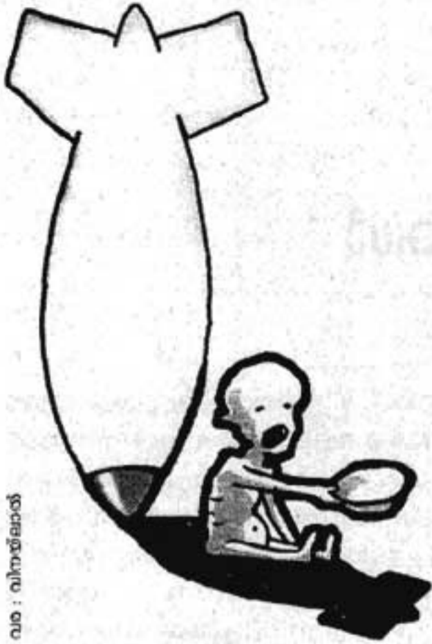
ചിത്രം : വിനയ്കുമാർ