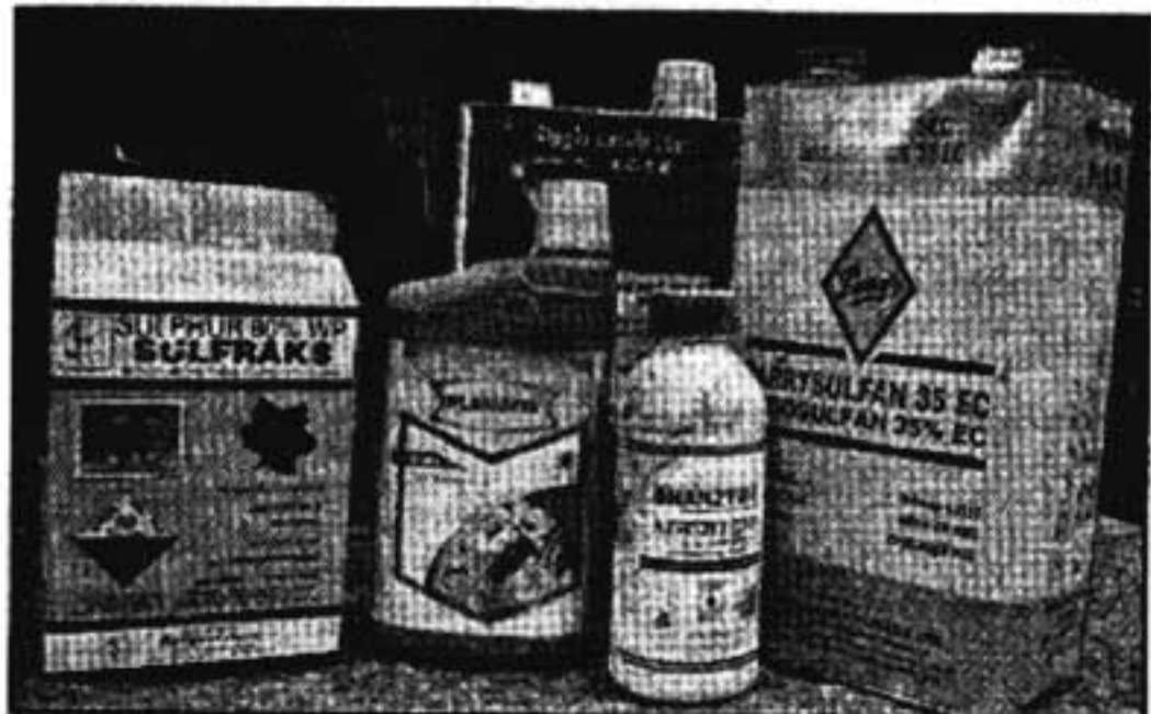
പാലക്കാടും ഇടുക്കിയിലും കേരളത്തിന്റെ തമിഴ്നാട് പ്രദേശങ്ങളിലും നിരോധിച്ചിട്ടും തെളിച്ചുകൊണ്ടിരിക്കുന്ന വിവിധയിനം അപകടകരമായ രാസ കള/കീടനാശിനികൾ

പ്രശ്നമാണെന്നോ? 42 നദികളാണ് മലേഷ്യയിലൂടെ ഒഴുകുന്നത്. ഏതാണ്ടെല്ലാംതന്നെ മലിനമാണ്. വ്യാവസായിക മാലിന്യങ്ങൾ പരിസ്ഥിതി സംരക്ഷണ നിയമങ്ങളൊക്കെയുണ്ടെങ്കിലും വൻകമ്പനികൾക്ക് മലിനീകരണം നടത്തിക്കൊണ്ടു തന്നെ രക്ഷപ്പെടുകയും ചെയ്യാം. പിഴ അടച്ചാൽ മതി. മലിനീകരണം ഇല്ലാതാക്കാൻ വേണ്ട സജ്ജീകരണങ്ങൾക്കുവേണ്ടിവരുന്ന ചെലവിനേക്കാൾ എത്രയോ കുറവാണ് ഫൈൻ അടയ്ക്കേണ്ട തുക. അതുകൊണ്ട് പിഴ മലിനീകരണം തടയാനുള്ള ഒരു നിവർത്തിമാർഗ്ഗമല്ല. പാഠ്യയിൽ കമ്പനികളുടെ മാലിന്യങ്ങൾ ഒഴുകുന്നത് നദികളിലേയ്ക്കാണ്. നദികളുടെ വൃഷ്ടി പ്രദേശങ്ങളിലൊക്കെ വൻ വേനസമൂച്ചയങ്ങൾ ഉയരുന്നു. അവയുടെ മാലിന്യങ്ങൾ ഒഴുകുന്നതും നദികളിലേയ്ക്കാണ്. കുന്നുകൾ ഇടിച്ചു നിരത്തപ്പെടുന്നു, മണ്ണൊലിപ്പ് കൂട്ടുന്നു. ഇതെല്ലാം നദികളെ വിപരീതമായി ബാധിക്കുന്നു. വൻ ജലവൈദ്യുത പദ്ധതികളും നദികളുടെ സ്വാഭാവിക ചംക്രമണത്തെ ബാധിക്കുന്നു. കേരളത്തിലെ അവസ്ഥയും ഏതാണ്ടി തൊക്കെത്തന്നെയാണ് എന്നാണ് ഞാൻ മനസ്സിലാക്കുന്നത്.