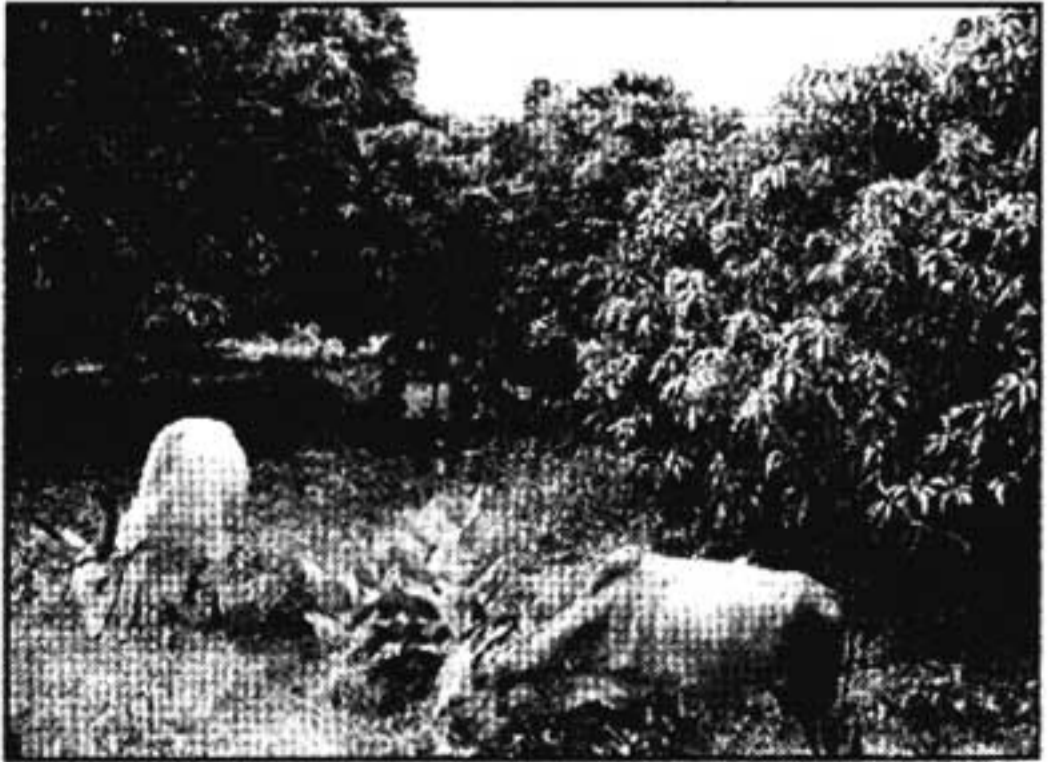
പാലക്കാട് ജില്ലയിലെ കൊല്ലങ്കോടിനടുത്തുള്ള പ്രദേശങ്ങൾ മാന്തോട്ടങ്ങൾക്ക് പ്രസിദ്ധമാണ്. ഇപ്പോൾ എൻഡോസൾഫാൻ തെളിക്കുന്നതിനാൽ അനാപാഗ്യ മേഖലയ്ക്ക് പ്രസിദ്ധം.

ഒരിക്കലുമല്ല. ഞങ്ങളുടെ അനുഭവവും അതുതന്നെയാണ് തെളിയിക്കുന്നത്. ഭർത്താവ് ഭാര്യയെ പീഡിപ്പിക്കുന്നുവെന്നു മാത്രമല്ല, അവളെ ചവിട്ടി പുറത്താക്കുകയും ചെയ്യുന്നു. ആക്രമിക്കപ്പെടുന്നവർ സ്വന്തം പാർപ്പിടത്തിൽനിന്നു നിഷ്കാസിതരുമാവുന്നു. നിയമം അവിടെ നിസ്സഹായമാവുന്നു. കാരണം, അക്രമിയുടെ പേരിലാണ് വീട്. വീട്ടിനുള്ളിൽ അക്രമം സഹിക്കേണ്ടിവരുന്ന സ്ത്രീകൾ കുറച്ചുദിവസം സർക്കാരിന്റെ പുനരധിവാസ കേന്ദ്രങ്ങളിൽ കഴിഞ്ഞിട്ട്, നിവർത്തിക്കേടുകൊണ്ട് ഭർത്താവിന്റെ വീട്ടിലേയ്ക്കു തന്നെ മടങ്ങിപ്പോവുന്നു. അപ്പോൾ പോലീസ് ഓഫീസർമാർ ഞങ്ങളോടു