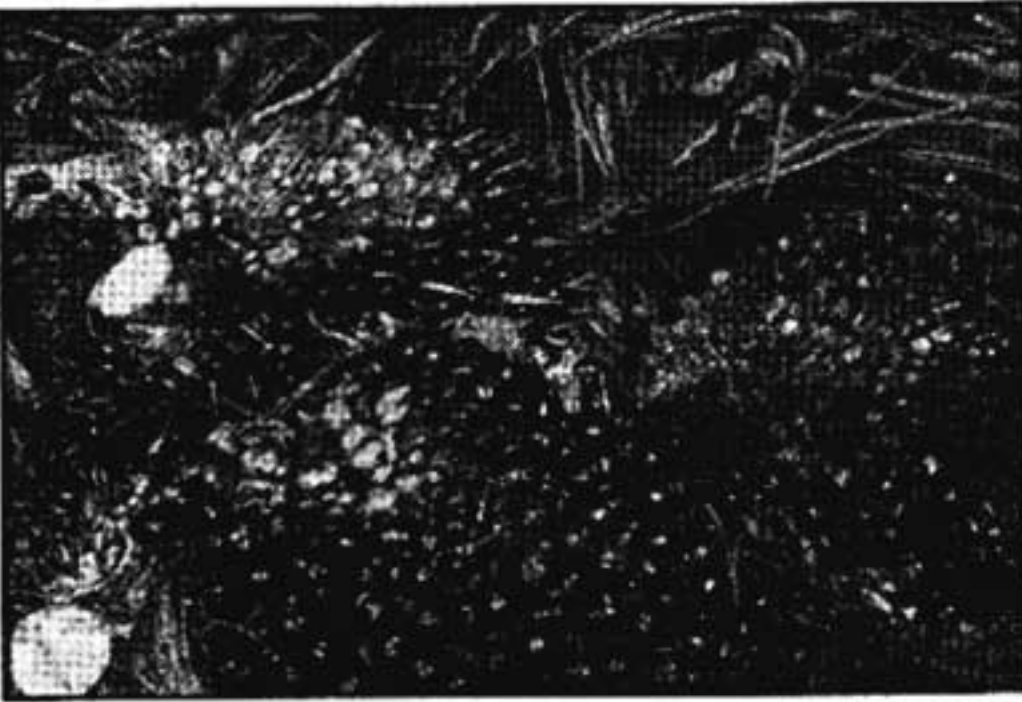
എണ്ണപ്പനയുടെ കൃല മഹാത്മാ

പാഠാലയിൽ ഒരു ജൈവഇന്ധനമായും ഉപയോഗിക്കാമെന്നു വന്നതോടെ കാര്യങ്ങൾക്കു മറ്റൊരു മാനം കൈവന്നിരിക്കുകയാണ്. ഒരു ഭക്ഷ്യവസ്തു യന്ത്രങ്ങൾക്ക് ഇന്ധനം ആയി മാറണോ എന്നതാണ് ആലോചിക്കേണ്ടത്. ഭക്ഷ്യസുരക്ഷയ്ക്കു പ്രാധാന്യമില്ലേ? ഏഷ്യയിൽ മാത്രം 60 കോടി ജനങ്ങളാണ് വിശപ്പിന്റെ ദൈന്യത അനുഭവിക്കുന്നത്. മൂന്നാം ലോകരാഷ്ട്രങ്ങളിൽ ലഭ്യമായ ഭൂമി എന്തിനുവേണ്ടി ഉപയോഗിക്കണം എന്തിനാണ് മുൻഗണന നൽകേണ്ടത് എന്നു വികസിത രാജ്യങ്ങളല്ലാ തീരുമാനിക്കേണ്ടത്. അവരെല്ലാം ഭക്ഷ്യസുരക്ഷ നേടിയ രാജ്യങ്ങളാണ്. ഇപ്പോഴും തങ്ങളുടെ കർഷകർക്ക് സബ്സിഡിയും നൽകുന്നു. ഭക്ഷ്യ