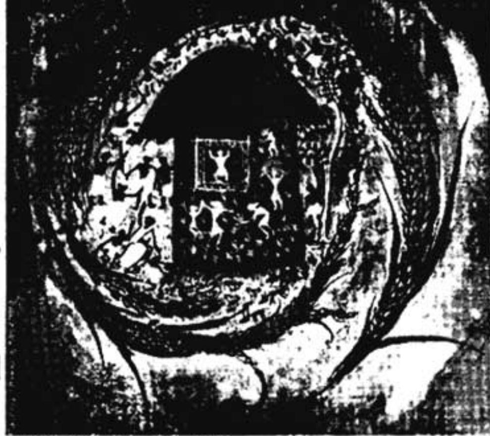
പെയിന്റിംഗ്: ധനരാജ് കിഴന