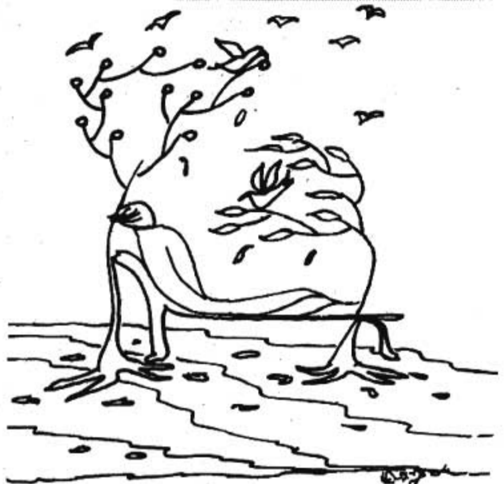
ചിത്രീകരണം : മോഹനൻ വി.

“അതേന്നേ ..... എയ്ഡ്സ്” അയാൾ ഒന്നുകൂടി സ്വരം താഴ്ത്തി പറഞ്ഞുതുടങ്ങി. “കള്ളുകുടിയനും താനോന്നിയുമാണെങ്കിലും അവൻ കുടുംബം നോക്കുന്നവനായിരുന്നു. കർണ്ണാടകത്തിലേക്ക് കൊപ്രയും മറ്റും കൊണ്ടുപോകുന്ന ഒരു ലോറി ട്രാൻസ്പോർട്ടിൽ സ്ഥിരം ജോലിക്കാരൻ. കല്യാണം കഴിഞ്ഞ് രണ്ടുവർഷമായതേയുള്ളൂ. ഒരു ചെറിയ