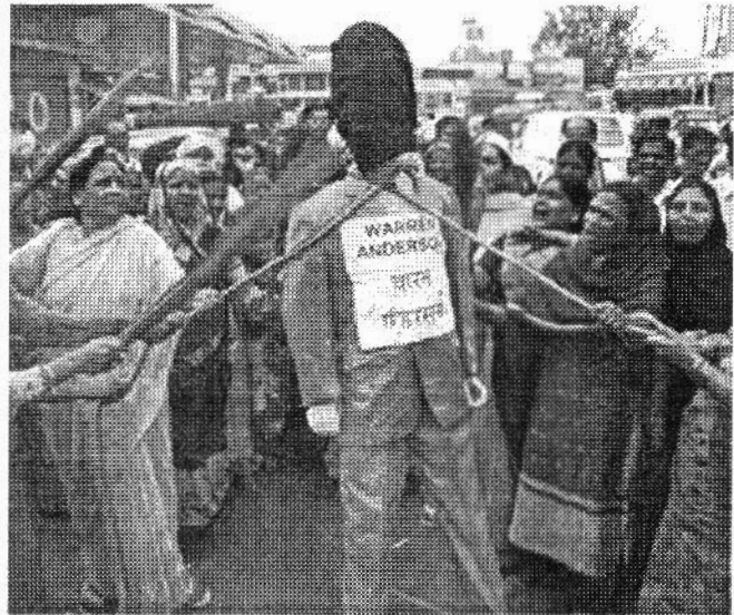
ഇന്ത്യയിൽ അദ്ദേഹത്തിനെതിരെ നടന്ന പ്രതിഷേധം

ഷണികൾ എടുത്തു പറഞ്ഞിരുന്നു. എങ്കിലും, അതുപ്രകാരം സുരക്ഷാ നടപടികൾ കൈക്കൊണ്ടത് അമേരിക്കൻ ഫാക്ടറിയിൽ മാത്രം. ഭോപ്പാൽ ഫാക്ടറിയിൽ അപകടാവസ്ഥ ഇല്ലാതാക്കാൻ കമ്പനി യാതൊന്നും ചെയ്തില്ല. മൂന്നറിയിപ്പുകൾ കാറ്റിൽ പറത്തിക്കൊണ്ട് മനുഷ്യജീവൻ യാതൊരു പരിഗണനയും കൊടുക്കാൻ കമ്പനിയുടെ ലാഭക്കൊതി തയ്യാറായില്ലെന്നതാണ് സത്യം. സുരക്ഷാനടപടികൾക്കു വേണ്ടിവരുന്ന ചെലവ് കമ്പനിയുടെ വാർഷികാദായത്തിൽ നിന്നും കുറഞ്ഞുപോകുമല്ലോ എന്ന കോർപ്പറേറ്റ് ദൂര ഇവിടെ മറന്നിരിക്കി പുറത്തു വരുന്നു. ഭോപ്പാൽ ദുരന്തത്തിന്റെ പ്രധാന കാരണവും മറ്റൊന്നല്ല.