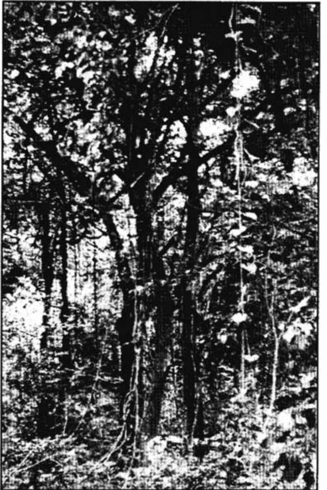
അന്തിമഹാകാളൻ കാട് (കാവ്)