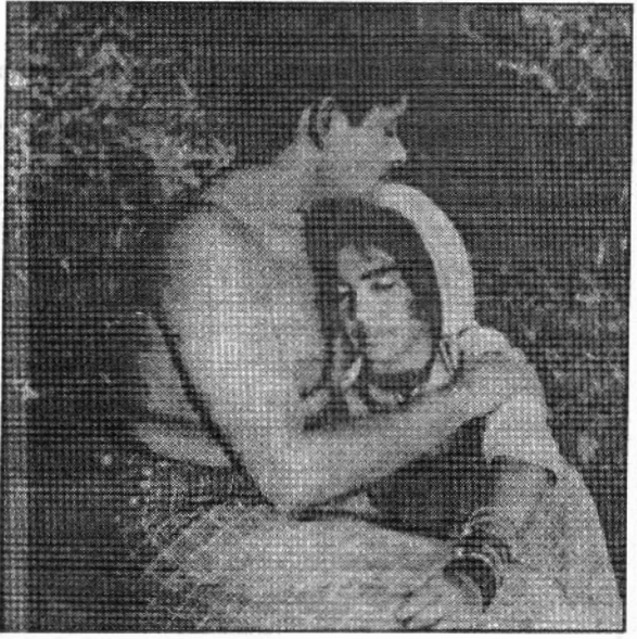
ഓളവും തീരവും (1970) - മധുവും ഉഷാനന്ദിനിയും

ബാ ലുകാലത്താണ്. നാലുനാഴികയിലധികം ദൂരമുണ്ട് ഏറ്റവുമടുത്ത സിനിമക്കൊട്ടകയിലേക്ക്. കുന്തിപ്പുഴ തീരത്ത് പുലാമത്തോളിൽ. ഓണം, വിഷു, തിരുവാതിര എന്നീ ആണ്ടുരൂതികളിലെ നാളുകൾ സിനിമയ്ക്കുപോവാറുള്ളു. പീടികച്ചായ കുടിക്കലും ഹോട്ടലുടിയും സിനിമയും ഇത്തിരി മ്ലേഹമായി കണ്ടിരുന്ന കാലമാണത്. എങ്കിലും ഓണക്കാലത്ത് സിനിമ കാണാൻ അന്നു വദിക്കപ്പെട്ടു. ഏറെ കരഞ്ഞു ബഹളം കൂട്ടിയിട്ടാണ്