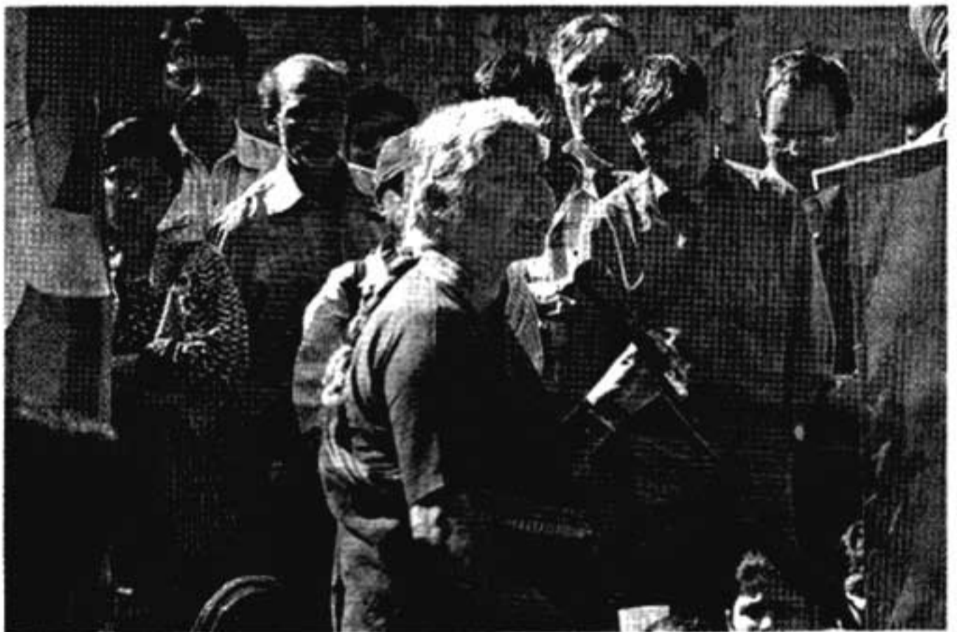
മേധാപട്കർ നന്ദിഗ്രാം സന്ദർശിച്ചപ്പോൾ

ഇതെഴുതുന്ന സമയത്ത്, നന്ദിഗ്രാമിലെ ഇന്നത്തെ അവസ്ഥയെക്കുറിച്ച് ഏറ്റവും അനുയോജ്യമായ