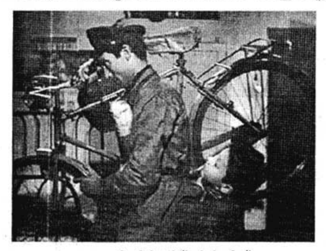
ബൈസിക്കിൾ തീവ്സിൽ നിന്ന്

സൂക്ഷ്മമായ അർത്ഥത്തിൽ (സൂക്ഷ്മ രാഷ്ട്രീയം എന്നൊക്കെ വേണമെങ്കിൽ പറയാം) സൈക്കിൾ ദേശീയതയുടെ പൊതുരൂപകമായി വേഷം പകരുമ്പോൾ മറ്റെല്ലാ ചെറുദേശീയതകളെയും അതിന്റെ വൃത്തപരിധിയിലേക്ക് നിർബന്ധിക്കുന്നു. അഥവാ ദൈനംദിനജീവിതത്തെ നിർണയിക്കുന്ന ജീവസന്ധാരണപരമായ ഒരു ഉപകരണ മായി, അനുഭവപ്പെടാത്ത മലയോര വാസികളുടെ രാഷ്ട്രീയ/വികസന ബദൽമാ തൃകയായി സൈക്കിൾ രൂപാന്തരപ്പെടുകയില്ല. കേരളത്തിന്റെ വികസനത്തെ സംബ ന്ധിക്കുന്ന സങ്കൽപ്പങ്ങളിലേക്ക് സൈക്കിൾ ഓടിച്ചുകയറ്റുമ്പോൾ, ഉന്തിക്കയറ്റിയും