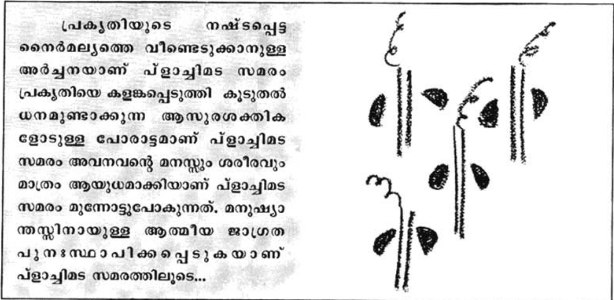
ചിത്രം : ലോർഡ്.കുമാർ

2006 ഡിസംബർ 10 മനുഷ്യാവകാശ ദിനത്തിൽ പ്ലാച്ചിമട സമരപന്തലിൽവെച്ച് ആഷാമേനോൻ നടത്തിയ പ്രഭാഷണത്തിൽ നിന്നുള്ള ഭാഗങ്ങൾ