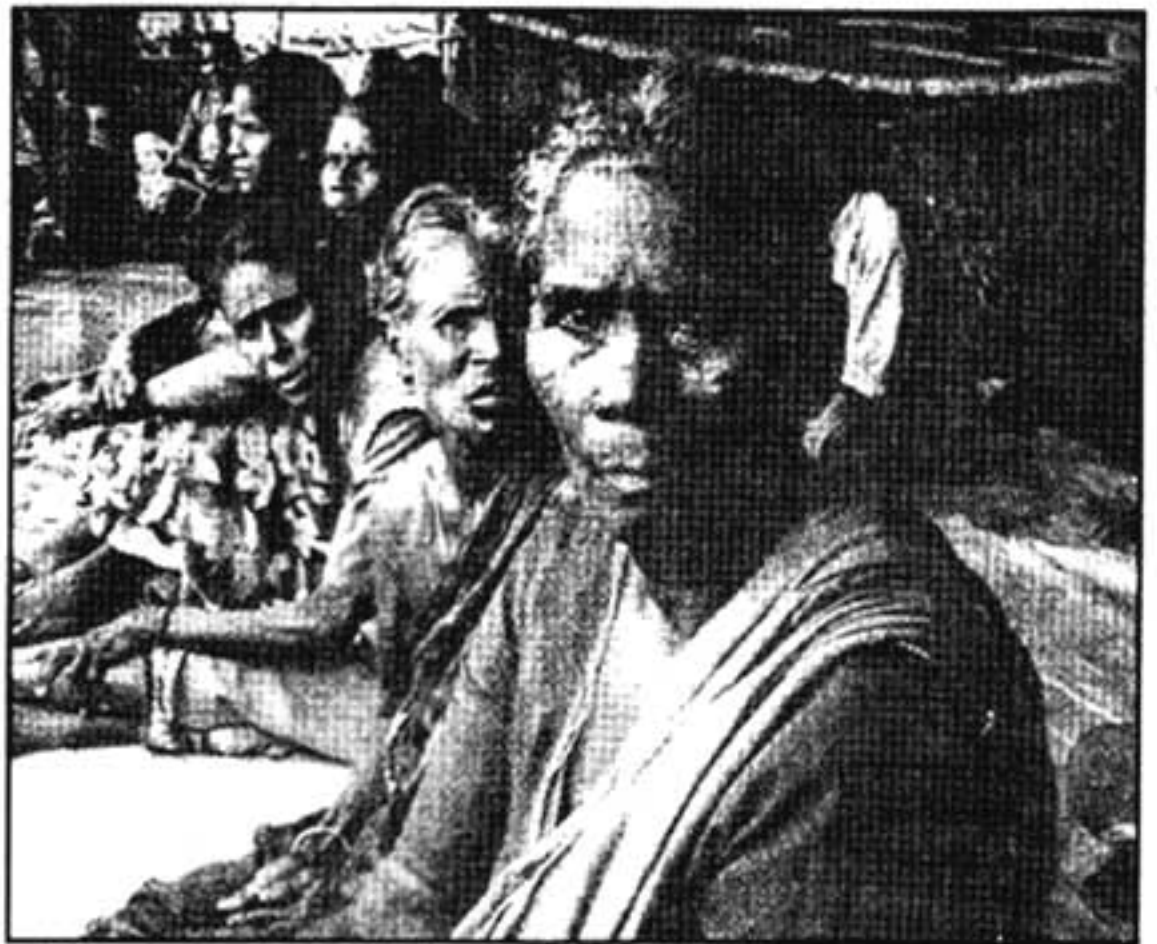
പ്ലാച്ചിമട സമരപന്തലിൽനിന്ന്

സമരപ്രവർത്തകരുടെയിടയിൽ നിന്നും സമരം പരിഹരിക്കുന്നതിന് ഉന്നയിക്കപ്പെട്ടിട്ടുള്ള ആവശ്യങ്ങൾ എന്തൊക്കെയാണ്? എന്ത് സംഭവിച്ചിലാണ് അവരുടെ ആവശ്യങ്ങൾ നിറവേറി എന്ന് അവർ അംഗീകരിക്കുന്നുണ്ടാവുക? ആർ എങ്ങിനെയാണ് ഇത് പ്രാവർത്തികമാക്കേണ്ടത്? സമരപ്രവർത്തകർ ഉന്നയിച്ച ആവശ്യങ്ങൾ നിറവേറേണ്ടത് ഗവൺമെന്റാണോ? ഗവൺമെന്റാണ് പരിഹരിക്കേണ്ടതെന്ന് ഉറപ്പുണ്ടെങ്കിൽ ഗവൺമെന്റ് എന്തുകൊണ്ട് പരിഹരിക്കാൻ തയ്യാ