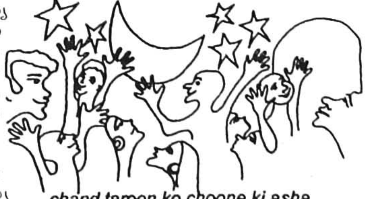
chand taroon ko choone ki asha

എന്നിവ കാം മാർഗ്ഗ് ഉല്പാദിപ്പിക്കുന്നു. കാം മാർഗ്ഗിൽ ചേർന്ന് വിദ്യാഭ്യാസം നടത്തുന്ന കുട്ടികളാണ് ഇവയെല്ലാം നിർമ്മിക്കുന്നത്. കടകളും പ്രദർശനങ്ങളും വഴിയാണ് ഈ ഉല്പന്നങ്ങൾ വിപണനം ചെയ്യുന്നത്. മുംബൈയിലും ഡെൽഹിയിലും പ്രവർത്തിക്കുന്ന 'പിപ്പിൾ ടീ' എന്ന സംഘടനയും വിപണനത്തിന് സഹായിക്കുന്നുണ്ട്. കുറ