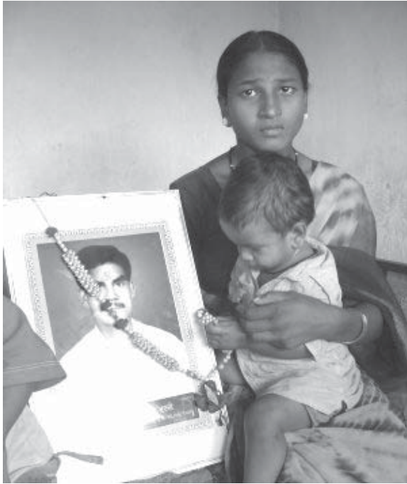
ആത്മഹത്യ ചെയ്ത കർഷകന്റെ ഭാര്യയും കുട്ടിയും. വിദഗ്ദ്ധരായിട്ടില്ലാത്തവർക്കുവേണ്ടി ദുരൂഹം

നഗരങ്ങളിലെ പുത്തൻ ജീവിതരീതികൾ തേടുന്ന ധനാധിഷ്ഠിതർക്ക് വഴിമാറിക്കൊടുക്കാനാണ്. 1993 മുതൽ 2007 വരെയുള്ള പതിനഞ്ചു വർഷങ്ങൾക്കിടയിൽ ആയിരക്കണക്കിന് ഗ്രാമീണബാങ്കുശാഖകൾ നിർമ്മാണത്തിലായിരുന്നു.