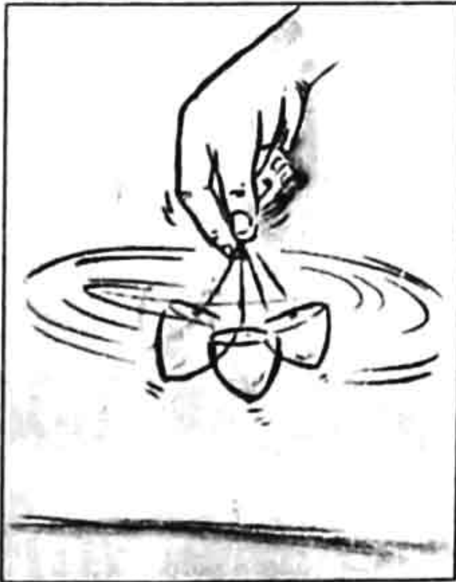
വര: ശ്രീകുമാർ. എ.വി.