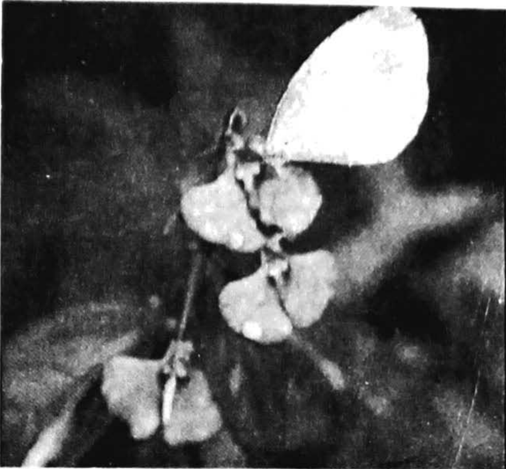
ഫോട്ടോ: ബാബു കാമ്പ്രത്ത്, പയ്യന്നൂർ