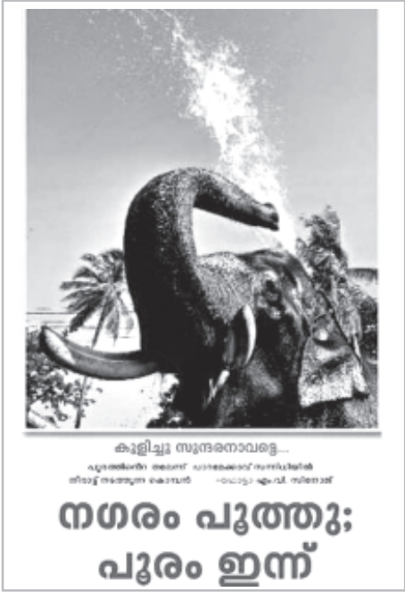
തൃശൂർ പുരത്തിന്റെ ദിവസം മാതൃഭൂമിയുടെ തൃശൂർ എഡിഷനിൽ ഒന്നാം പേജിൽ വന്ന ആനയുടെ ചിത്രം.