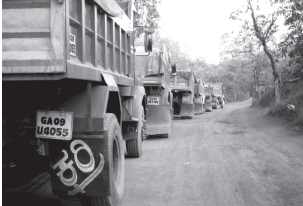
ഗോവയിലെ ഇരുമ്പ് ഖനികളിൽ നിന്നും മടങ്ങുന്ന ലോറികൾ.

⇒ 2004ൽ ചൈന കമ്പനികൾ ഗോവൻ ഖനികളിൽ കണ്ണുവച്ചതോടെ സ്ഥിതിഗതികൾ മാറിമറിഞ്ഞു ⇒