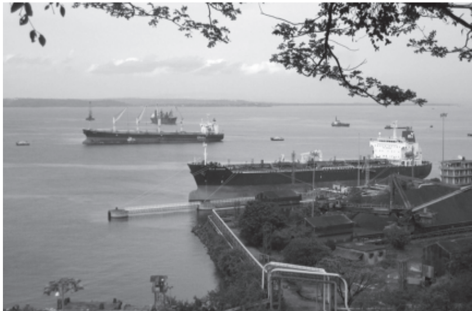
ഇരുമ്പയിർ കൊണ്ടുപോകുന്നതിനായി ഗേവൻ തീരത്ത് നങ്കൂരമിട്ടിരിക്കുന്ന കപ്പലുകൾ

ളരക്കാലം മുമ്പേ ചിന്തിച്ചു തുടങ്ങിയിരു ന്നു. വിദ്യാഭ്യാസ സമ്പ്രദായത്തിലാണ് മുഖ്യ മായും അധിനിവേശ രാജ്യത്തിന്റെ സാംസ് കാരിക ശീലങ്ങൾ ആഴ്ന്നിറങ്ങിയിരുന്നത്. മൂന്നാംലോക രാജ്യങ്ങളിലെല്ലാം ഇത് നി ണ്ടുൾക്ക് കാണാൻ കഴിയും. ഇന്ത്യയിൽ നില നിന്നിരുന്ന തനത് പാരമ്പര്യത്തെ പിന്തുടരുന്ന ഒരു വിദ്യാഭ്യാസ രീതി എവിടെയും നമു ക്ക് കാണാൻ കഴിയില്ല. ഇന്ത്യൻ യൂണിവേഴ് സിറ്റികളുടെ പ്രവർത്തനരീതി പരിശോധി ച്ചാൽ പടിഞ്ഞാറിനെ പകർത്തിവയ്ക്കാനു ള്ള ഒരു ശ്രമമാണ് അത് നടത്തുന്നതെന്ന് മ