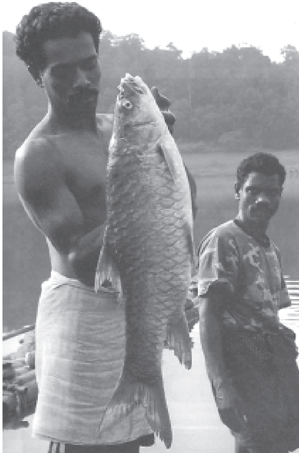
“മീൻപിടുത്തമാണ് കാടരുടെ പരമ്പരാഗതമായ ഒരു ഉപജീവനമാർഗ്ഗം. പുഴയിൽ നിന്നും പിടിച്ച മീനുമായി സെത്തിൽ.

ഞങ്ങൾ ശേഖരിക്കുന്ന വനവിഭവങ്ങൾ എടുക്കുന്നതിനായി പട്ടികവർഗ്ഗ സൊസൈറ്റി നിലവിലുണ്ടായിരുന്നു. ഷോളയാർ പട്ടികവർഗ്ഗ സർവ്വീസ് സഹകരണ സംഘം എന്ന പേരിലുള്ള സൊസൈറ്റി ആദിവാസികളുടെ ക്ഷേമത്തിനായി രൂപീകരിച്ചതാണ്. വാഴച്ചാൽ മുതൽ മലക്കപ്പാറ വരെയുള്ള 13 കോളനികളുടെയും ചുമതല സൊസൈറ്റിക്കായിരുന്നു. എഴുപതുകളിലാണ് സൊസൈറ്റിയും രൂപീകൃതമാകുന്നത്. അതിന് മുമ്പ് മാറ്റക്കട എന്ന സമ്പ്രദായത്തിലൂടെയായിരുന്നു ഞങ്ങൾ സാധനങ്ങൾ കൊടുത്തിരുന്നത്. ഞങ്ങൾ ശേഖരിക്കുന്ന മലഞ്ചരക്കുകൾ കച്ചവടക്കാർക്ക് കൊടുക്കുകയും അവർ അരി പോലെയുള്ള അവശ്യ സാധനങ്ങൾ പകരം തരുകയും ചെയ്യുന്നതായിരുന്നു മാറ്റക്കട സമ്പ്രദായം. മലഞ്ചരക്കുകളുടെ വിലയെക്കുറിച്ചൊന്നും അന്ന് ഞങ്ങൾക്ക് ധാരണയുണ്ടായിരുന്നില്ല. സൊസൈറ്റി വന്നതോടെ മലഞ്ചരക്കുകൾ ഞങ്ങൾ അവിടെ കൊടുക്കാൻ തുടങ്ങി. അതോടെയാണ് പണം കിട്ടിത്തുടങ്ങുന്നത്. പിന്നെ ബോണസും കിട്ടും. സൊസൈറ്റിയിൽ ബോർഡ് മെമ്പർമാരായി ആദിവാസികളുണ്ടെങ്കിലും കൂടുതലും പുറത്ത് നിന്നുള്ളവരാണുള്ളത്. അവരുടെ ശമ്പളവും സംവിധാനങ്ങളുമൊക്കെ സംരക്ഷിക്കുന്നതിനാണ് കൂടുതൽ പണവും ചിലവഴിക്കുന്നത്. സൊസൈറ്റിയുടെ സെക്രട്ടറിയാണ് കാര്യങ്ങളൊക്കെ നിയന്ത്രിച്ചിരുന്നത്. സർക്കാർ ഉദ്യോഗസ്ഥനാണ് സെക്രട്ടറി. ആദിവാസികളോട് പ