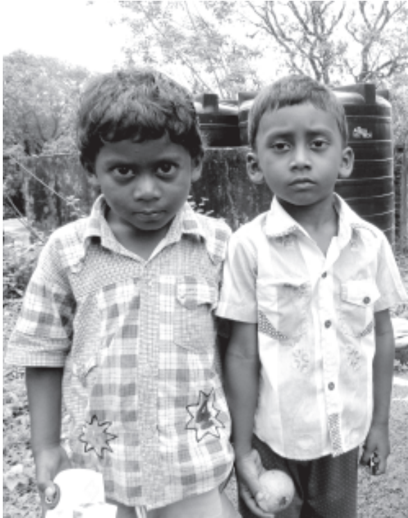
മലക്കപ്പാറ ഉൾപ്പെടെ കാടർ ആദിവാസി കുട്ടികൾ

കാരത്തിന് ലഭിച്ച ഒരു അംഗീകാരമായിരുന്നു അത്. ഇത്തവണ മൺസൂൺ കഴിഞ്ഞപ്പോൾ പുഴയിൽ നിറയെ മീനൂണ്ടായിരുന്നു. ആദിവാസികൾക്ക് വനാവകാശം നൽകിയാൽ അവർ കാട് വെട്ടിനശിപ്പിക്കുമെന്ന് പറയുന്നവർ ഇക്കാര്യങ്ങൾ കൂടി കാണേണ്ടതുണ്ട്. കാടും പുഴയുമെല്ലാം നിലനിൽക്കണമെന്ന ബോധം ഞങ്ങൾക്കിടയിൽ കൂടിക്കൂടി വരുന്നുണ്ട്. പണ്ട് പലരും കാട് നശിപ്പിക്കുന്ന തരത്തിലുള്ള പല പരിപാടികൾക്കും ഞങ്ങളെ ഉപയോഗിച്ചിട്ടുണ്ട്. ബ്രിട്ടീഷുകാരുടെ കാലം മുതൽക്കേ തടിവെട്ടാനും വേട്ടയാടാനുമെല്ലാം കാടരെ കൂടെക്കൂട്ടിയിട്ടുണ്ട്. ഇന്ന് ഊരുകളിലുള്ളവർ അത്തരം ഇടപാടുകൾക്കൊന്നും കൂട്ടുനിൽക്കുമെന്ന് എനിക്ക് തോന്നുന്നില്ല. അമിത മദ്യപാനത്തിന്റെ പ്രശ്നം ഇവിടെ രൂക്ഷമായിരുന്നു എന്ന് കേട്ടിട്ടുണ്ട്. അത് കുറയ്ക്കാൻ കഴിയുന്നതരത്തിലുള്ള ഇടപെടലുകൾ ഊരുക്കൂട്ടത്തിന് നടത്താൻ കഴിയില്ലേ? മദ്യപാനം ഞങ്ങളുടെ ആളുകളെ ഒരുപാട് നശിപ്പിച്ചിട്ടുണ്ട്. പല പ്രവർത്തനങ്ങളിലൂടെയും മദ്യപാനം പരമാവധി കുറയ്ക്കാൻ കഴിഞ്ഞിട്ടുണ്ട്. തമിഴ്നാടിന്റെ ബിവറേജസ് ഔട്ട്