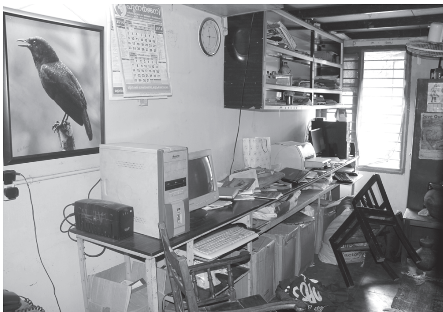
റെയ്ഡ് ചെയ്യപ്പെട്ട കേരളീയം ഓഫീസ്

⇒ എനിക്ക് മൊബൈലും ലാൻഡ് ഫോണും ഇല്ലെന്ന് ഞാൻ പറഞ്ഞു ⇒