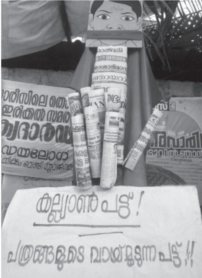
വാർത്താ തമസ്കരണത്തിനെതിരായ ഇരിക്കൽ സമരത്തിന്റെ പ്രതിഷേധം

⇒ ആ ധീരപ്രതികരണത്തിന്റെ കുടി ഫലമാകണം അദ്ദേഹം ഇന്ന് പാർട്ടിയുടെ സെൻട്രൽ കമ്മിറ്റി അംഗമാണ് ⇒