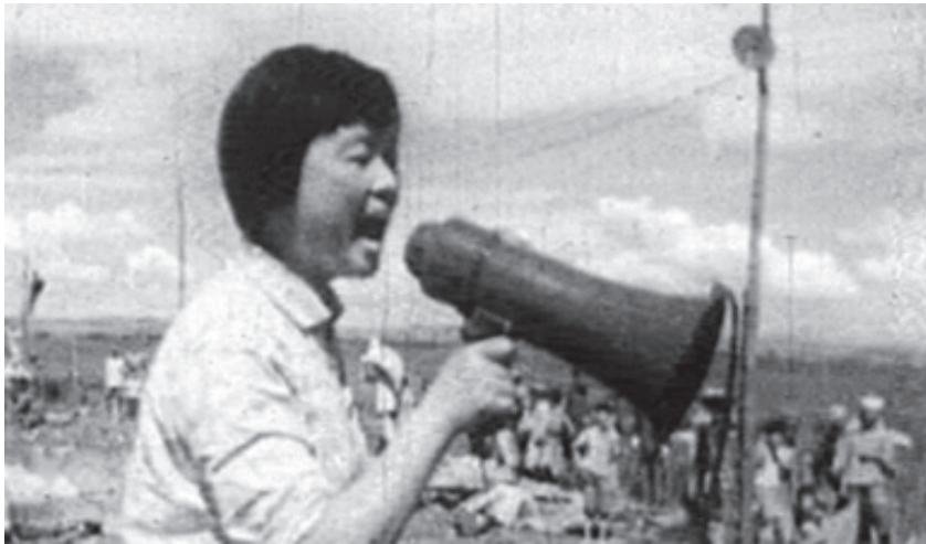
'മാൻ ക്യാൻ കോൺക്വേർ നേച്ചർ' എന്ന മാവോ സേതുങ്ങിന്റെ കാമ്പയിനിന്റെ ഭാഗമായി ഡയാച്ചി തടാകം നികത്താൻ നേതൃത്വം നൽകുന്ന യുവതി. ചൈനീസ് നാഷണൽ ആർമിക്കെതിരെ ദൃശ്യത്തിൽ നിന്നും.

⇒ യന്ത്രങ്ങളല്ല, സൈന്യത്തിന്റെ കായികശേഷിയാണ് അതിനായി ഉപയോഗിക്കപ്പെട്ടത് ⇒