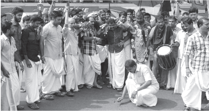
തൃശൂർ നഗരത്തിൽ പൊട്ടസ്റ്റ് പൊട്ടിച്ച് പ്രതിഷേധിക്കുന്ന പൂര പ്രേമികൾ

⇒ ഇത്രയും കേട്ടാൽ തൃശൂരിൽ വെടിക്കെട്ടും ആനയെഴുന്നള്ളിപ്പും നടക്കുമെന്ന് ആരെങ്കിലും കരുതുമോ? ⇒