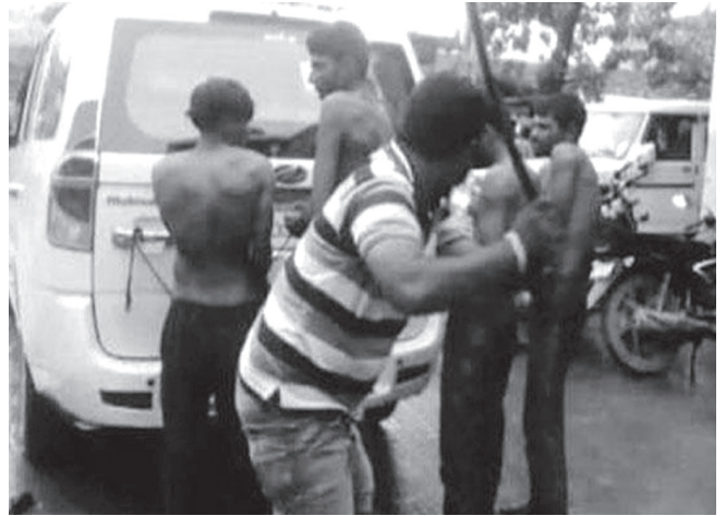
ഗുജറാത്തിലെ ഉനയിലെ മർദ്ദനം.

എന്നാൽ ദളിത് സഹോദരന്മാർക്കെതിരെ ഇപ്പോഴും നടന്നുകൊണ്ടിരിക്കുന്ന കാര്യങ്ങൾ കേൾക്കുമ്പോൾ എന്റെ ശിരസ്സ് അപമാനഭാരംകൊണ്ട് താഴ്ന്നുപോകുന്നു. എഴുപത് വർഷം പിന്നിട്ടിരിക്കുന്നു ഇന്ത്യ സ്വതന്ത്ര്യമായിട്ട്. ഇനിയും നമുക്ക് കാത്തിരിക്കാൻ കഴിയില്ല. കൂടുതൽ വ്യക്തമായ ദിശാബോധം നമുക്ക് വേണം." ലുധിയാനയിൽ വെച്ച് ദേശീയ എസ്.സി/എസ്.ടി ഹബ്ബ് ഉദ്ഘാടനം ചെയ്തുകൊണ്ടാണ് അദ്ദേഹം ഇങ്ങനെ വിനയാന്വിതനായത്.