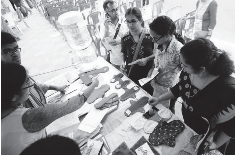
സസ്റ്റൈനബിൾ മെൻസ് ട്രേഷർ കേരളയുടെ ആഭിമുഖ്യത്തിൽ കഴിഞ്ഞ വനിതാ ദിനത്തിൽ തിരുവനന്തപുരം മാനവീയം വീഥിയിൽ നടത്തിയ പരിപാടിയിൽ തുണികൊണ്ടുള്ള സാനിറ്ററി പാഡുകൾ പരിചയപ്പെടുത്തുന്നു.