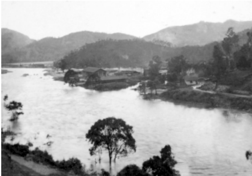
മൂന്നാർ 1924ലെ വെള്ളപ്പൊക്കത്തിൽ

⇒ സുപ്രീംകോടതി തന്നെ അവർക്ക് ഉടമസ്ഥാവകാശം ഇല്ല എന്ന് വ്യക്തമാക്കിയിരുന്നു ⇒