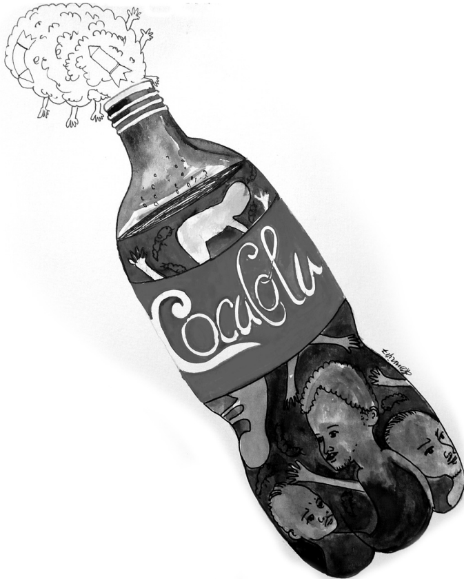
വര: കന്നി. എം

⇒ ബില്ലിൽ പ്രതിപാദിക്കുന്ന വിഷയങ്ങൾ സംസ്ഥാന സർക്കാരിന്റെ പരിധിയിൽ വരുന്നവയാണ് ⇒